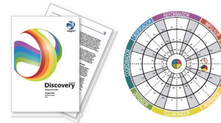
La dinámica de colores de Insights Discovery®